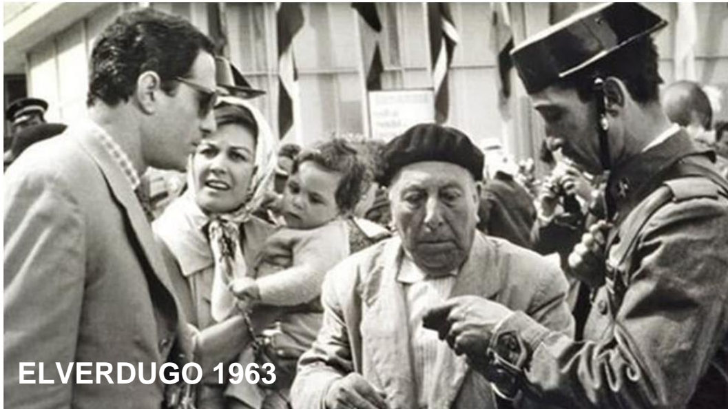
EL VERDUGO 1963