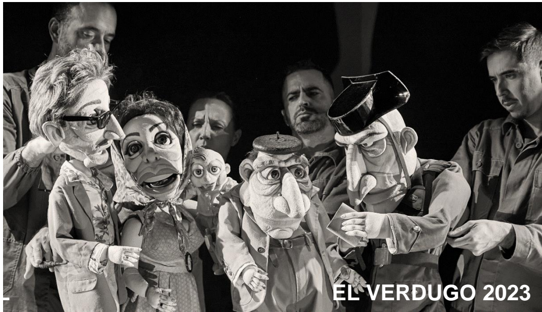
EL VERDUGO 2023