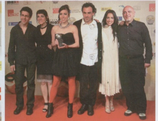
Los integrantes de La Vi E Bel, ganadores del Max al Mejor Espectáculo de Teatro Musical, por "Cabaret Líquido".