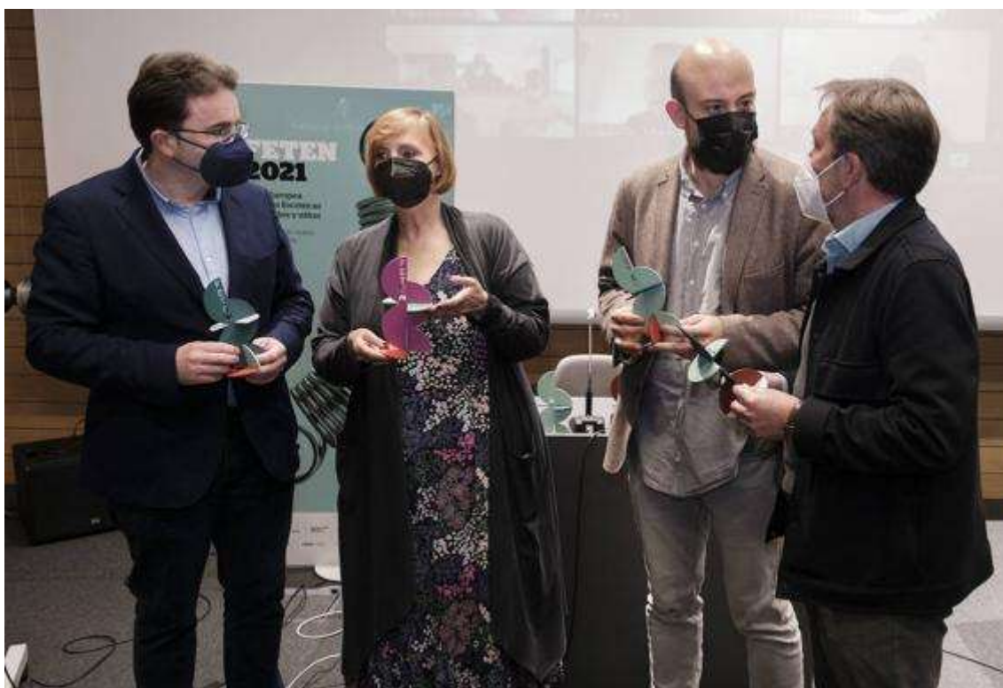
El acto celebrado para emitir el fallo de Feten 2021 / Carolina Santos

La compañía El Callejón del Gato fue la única asturiana galardonada, en la categoría Mejor adaptación del texto original