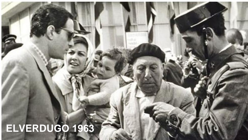
EL VERDUGO 1963