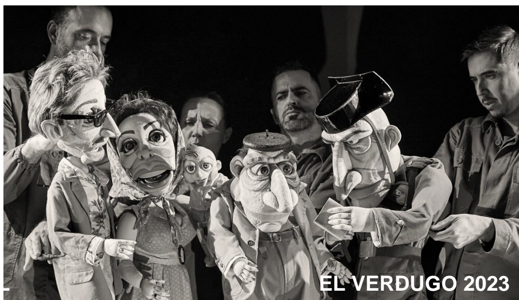
EL VERDUGO 2023