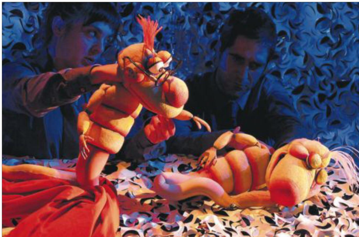
Montaje de la obra El fantástico viaje de Jonás el espermatozoide , el montaje ganador de la 29 edición del festival Titirijai.