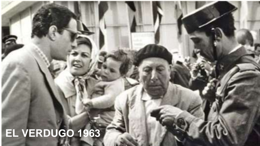
EL VERDUGO 1963