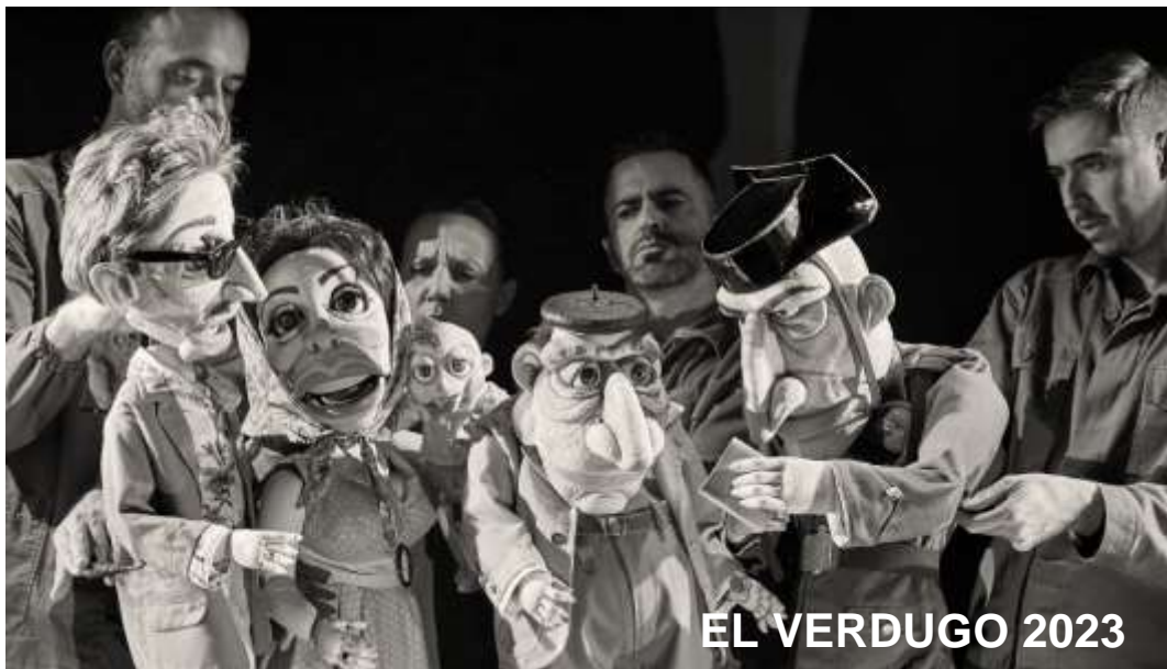
EL VERDUGO 2023