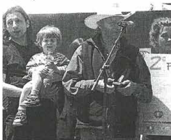
Circo Ronaldo, ganadores del premio 'Emilio Zapatero'.