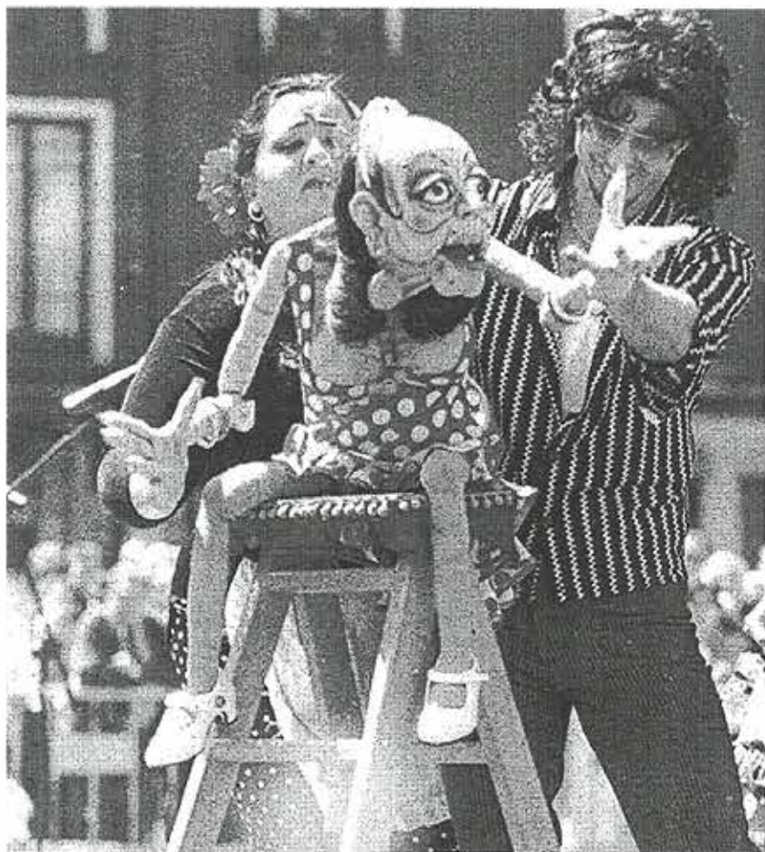
Espejo Negro durante la representación de 'La cabra'.