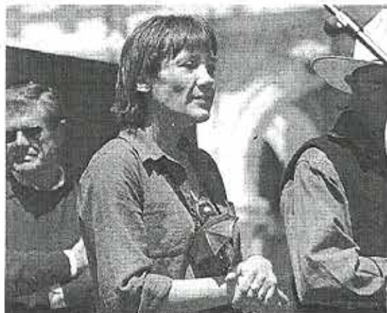
Trans Express, premio del público. / J. RODRÍGUEZ